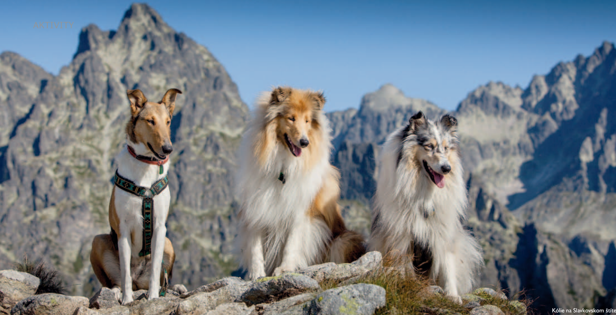
Kólie na Slavkovskom štíte

Tatranská turistika patrí určite k tým najkrajším na našom území vôbec. Naše hory sú našou veľkou pýchou a turista si odnáša domov len tie najkrajšie dojmy. Nezabudnuteľné výhľady, neopakovateľná a jedinečná príroda, dobrodružstvo v teréne... to sú veci, ktoré ľudí lákajú do hôr. A o tieto pocity sa pochopiteľne väčšina turistov – psičkárov chce podeliť i so svojim štvornohým priateľom. Pobyt v horách so sebou však prináša i určité špecifiká. A presne o nich je tento článok.