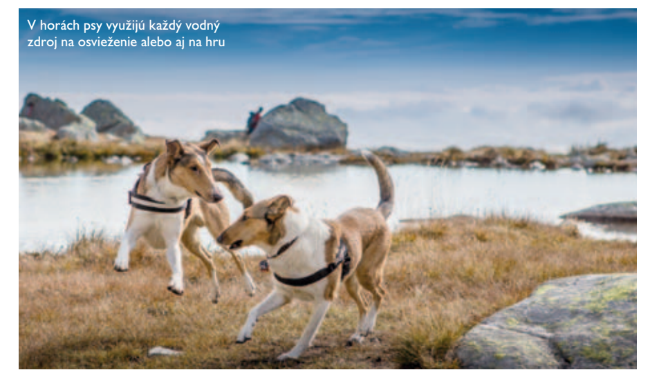
V horách psy využijú každý vodný zdroj na osvieženie alebo aj na hru