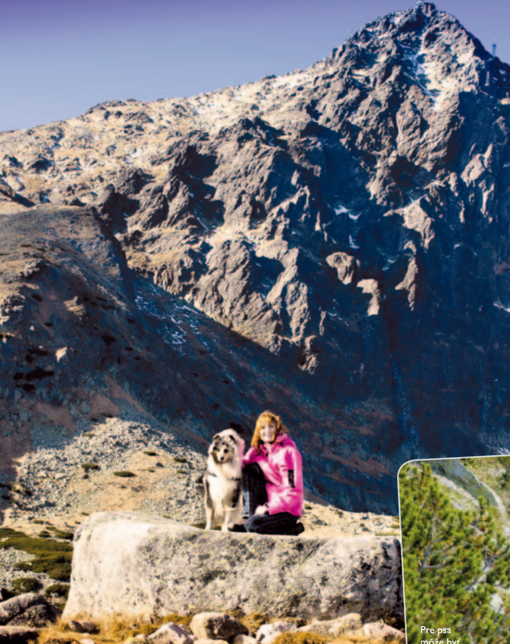
Panoráma pod známym Lomnickým štítom

ných územiach so štvrtým a piatym stupňom ochrany platí zákaz voľného púšťania, vodenia a nosenia psov.“