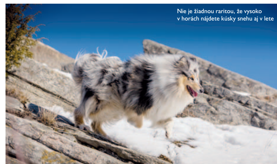
Nie je žiadnou raritou, že vysoko v horách nájdete kúsky snehu aj v lete

„Vodenie psov je povolené len za podmienky, že váš pes bude na vodiacom remeni a bude mať nasadený ochranný košík; v chránenej